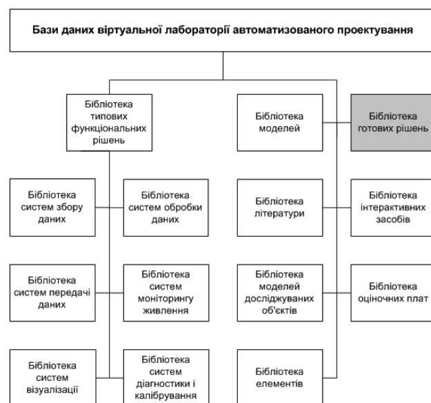
Рис. 3. Структура баз даних (бібліотек) ВЛАП

Як видно з рис. 1, ВЛАП складається з наступних основних елементів, а саме: баз даних (бібліотек), програмних засобів і технічних засобів. В свою чергу, бази даних поділяються на окремі бібліотеки (рис. 3). Темним фоном на рис. 3 виділена бібліотека, яка розроблена у співпраці з фахівцями з вітчизняних науково-дослідних інститутів та університетів [7].