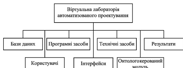
Рис. 1. Верхній рівень структури ВЛАП

нюється тим, що однією з основних функцій ВЛАП є інформаційне забезпечення [6].