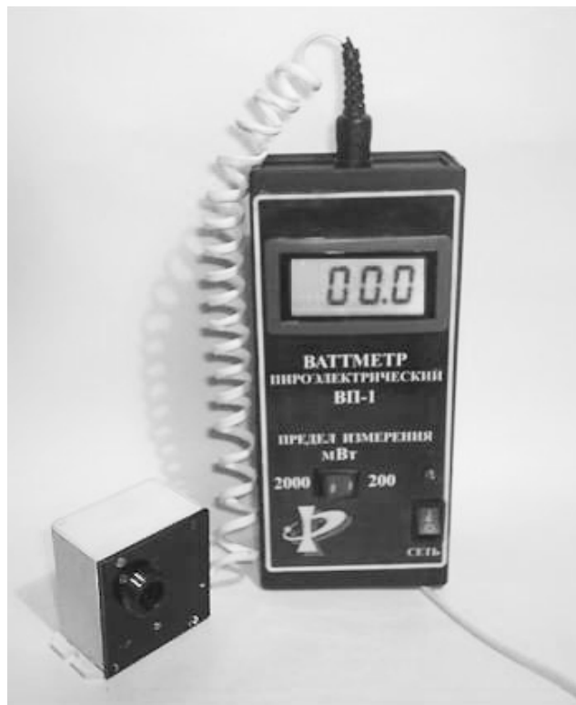
Рис. 1. Зовнішній вигляд піроелектричного вимірювача потужності випромінювання ВП-1.

Зовнішній вигляд піроелектричного ватметра ВП-1 подано на Рис. 1., а його структурну схему – на Рис. 2. Конструктивно вимірювач складається з приймальної голівки, розташованої в металевому корпусі, та блоку індикації, розташованому в пластмасовому корпусі. Приймальна голівка містить електромеханічний модулятор чашкообразного типу (Рис. 3), призначений для перетворення безперервного випромінювання у змінне з частотою 20 Гц, піроелектричний приймач випромінювання і узгоджувач підсилювач. Піроелектричний чутливий елемент являє собою пластину з танталату літія з напиленими електродами, напаяну на мідний тепловідвод, та з поглинаючим покриттям, яке забезпечує неселективність приладу в спектральному діапазоні 0,25...12 мкм. Пучок випромінювання проходить через захисне вікно, виконане з фтористого барію, і потрапляє на модулятор. З приймальної голівки, посилений сигнал поступає у блок індикації, який складається з блоку живлення, блоку калібрування і вольтметра.