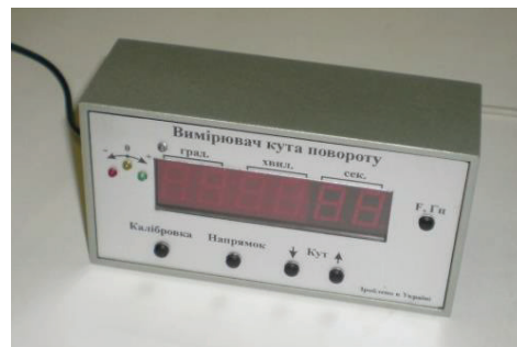
Рис. 2. Електронний вимірювач кута повороту.

ЕМП містить кроковий двигун (КД), редуктор з коефіцієнтом уповільнення 90. З можливістю ручного керування кутом повороту вихідної осі для установки початку (або кінця) діапазону датчика. До вихідної осі редуктора прикріплена стрілка, а до корпусу – транспортер, для візуального контролю виміру кута.