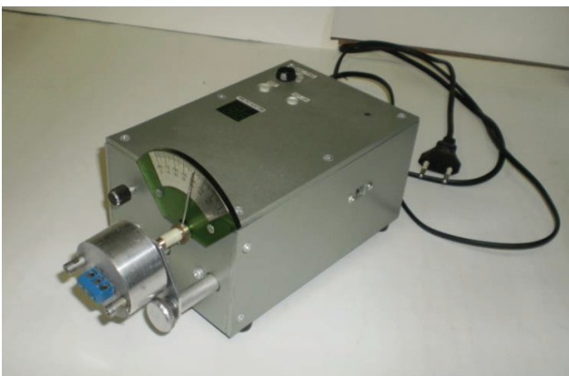
Рис. 1. Електромеханічний програматор.

Електромеханічний програматор (ЕМП) призначено для програмування вимірника кута повороту, а також контролю вірності його налаштування. При дослідженні кутової залежності фазової швидкості в п'єзокристалі, а також для атестації відповідних датчиків. ЕМП забезпечує зміни кута повороту з кроком 0,5°, 1,0°, 1,5° і 2,0° з похибкою не більше 6'. На рис. 1 показано електромеханічний програматор, а на рис.2 електронний вимірювач кута повороту.